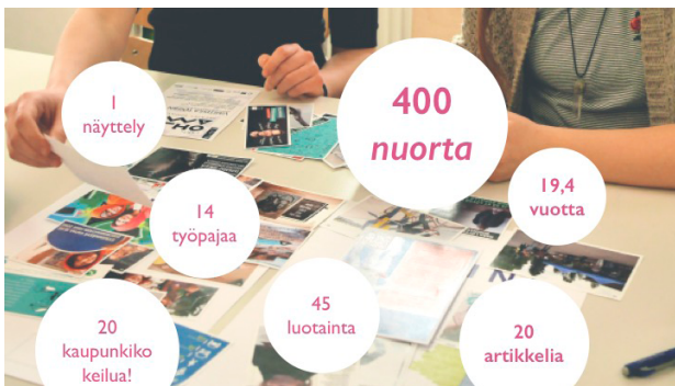
Kaupunki nuorten palveluna – hankkeen työ numeroina.

Käyttäjätutkimuksen avulla pyrittiin ymmärtämään sitä, missä ja miten nuoret elävät, asuvat, tekevät työtä, opiskelevat, liikkuvat ja etsivät tietoa sekä sitä, miten nuoret olisivat valmiita aloittamaan julkisten palvelujen käytön. Selvitimme, millaisesta tulevaisuudesta nuoret unelmoivat ja kuinka kaupunki voisi vastata näihin tarpeisiin sekä rakennetun ympäristön että palveluympäristön puitteissa.