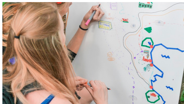
Nuoret kaupunkisuunnittelijoina. SummerUp-festivaali Lahdessa 2017.

Kaupunkimuotoilussa tulevaisuuden ennakointi on suunnittelun keskiössä. Kuinka oivaltaa kaupunkilaisten tulevaisuuden tarpeita? Lahden korkeakoulukeskuksen uuden kampusalueen kehittäminen nuoria kuunnellen oli yksi hankkeen päätöistä. Hankkeeseen tehtiin useita opinnäytetöitä, ja kaupunkimuotoilun opinnäytetyö Koti Niemessä (2018) palkittiin Lahden Muotoiluinstituutin parhaana opinnäytetyönä. Työssä suunniteltu kampusraitti rakennettiin alueelle jo syksyllä 2018. Alueelle rakennetaan suunnittelutyön pohjalta myös tulevaisuuden opiskelija-asumisen tarpeisiin vastaava oppilastalo.