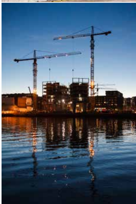
Jätkäsaari, kuvat Helsingin kaupungin aineistopankki, Tero Pajukallio