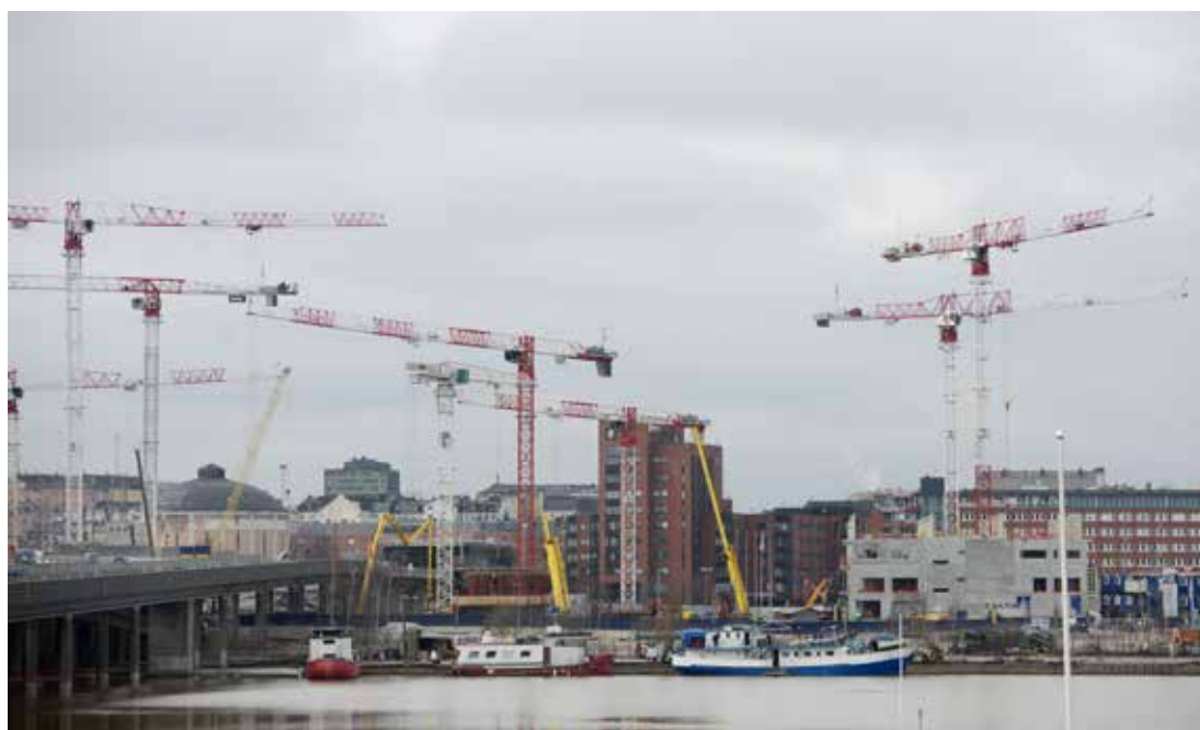
Kalasatama, Kauppakeskus REDIn työmaa