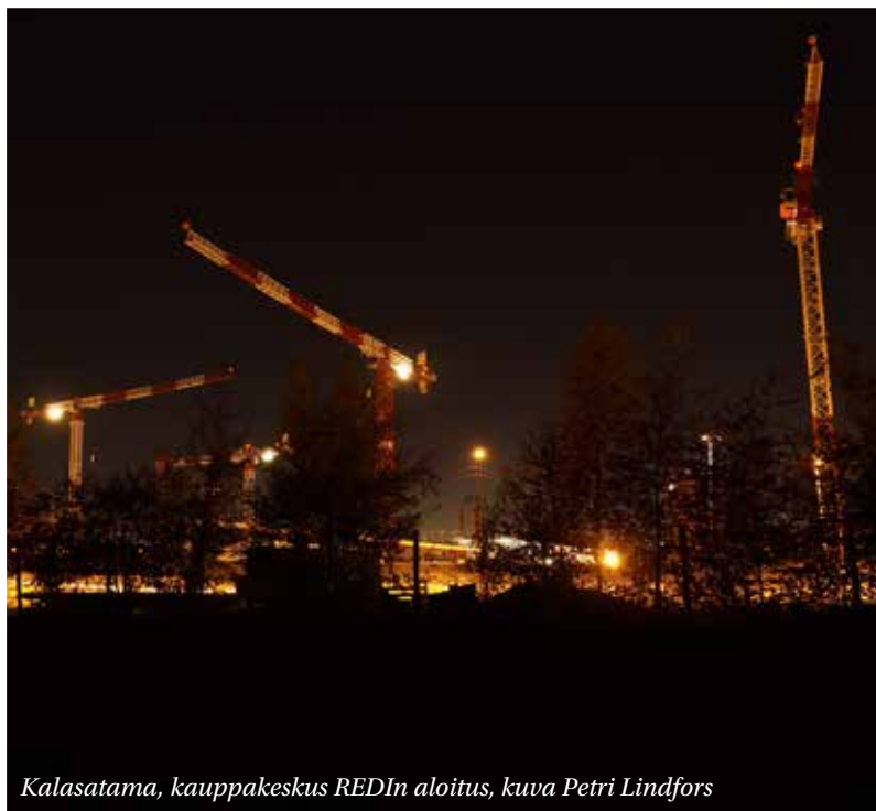
Kalasatama, kauppakeskus REDIn aloitus

Koska kirjallisuuskatsauksen tavoitteena on tarkastella kaupunki uudistuksia erityisesti tieteellisen keskustelun näkökulmasta, on ensisijaisena lähteenä käytetty vertaisarvioitua tutkimuskirjallisuutta. Tämän lisäksi katsauksessa tarkastellaan myös muuta aineistoa, kuten EU-komission puolesta tehtyä URBAN II -aloitteen arviointia. URBAN II -arvioinnissa on koostettu yhteen tuloksia tapaustutkimuksista, joissa on muun muassa haastateltu uudistusten keskeisiä osakkaita (Ex-Post Evaluation of The URBAN Community Initiative 2001–2006 (2010)). Tieteellisen keskustelun ulkopuolinen raportti tarjoaa näkökulman, jota vasten tutkimuskirjallisuudessa esiintyviä diskursseja voidaan tarkastella. Lisäksi useisiin tutkimusartikkeleihin verrattuna siinä on eritelty seikkaperäisemmin uudistusten sisältöä käytännössä.