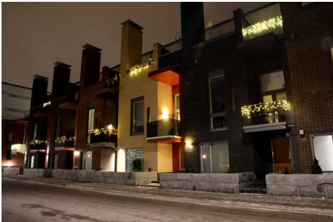
Kalasadama, kuva Helsingin kaupungin aineistopankki, Tero Pajukallio

Kirjallisuudessa käsiteltävien eurooppalaisten aluekehittämishankkeiden kattava tyyppittely on haastavaa, sillä käytännöt ja toimijat ovat moninaisia ja tarkat kuvaukset toimenpiteistä saattavat puuttua. Kuten edellisessä kappaleessa todetaan, useiden hankkeiden taustalla on kuitenkin sosiaaliset päämäärät. Tämän ryhmän sisällä hankkeiden voidaan karkeasti katsoa jakautuvan sellaisiin, joissa käytetään ensisijaisesti laajamittaisia fyysisiä keinoja, kuten esimerkiksi Cardiff Bayssä (Dixon & Ng'ombe 2011) ja sellaisiin, joissa suoraan sosiaalista toimintaa lisäävillä pienimittakaavaisemmilla toimilla on suurempi rooli.