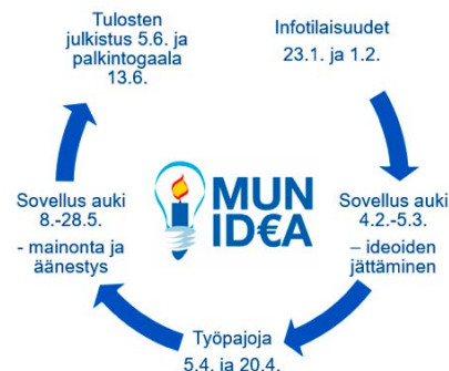
Osallistuvan budjetoinnin prosessi Espoon keskuksessa.

Asukkaat, virkamiehet ja kaupungin asiantuntijat kehittivät osallistuvan budjetoinnin toimintamallia yhdessä tutkijoiden kanssa osallistavan toimintatutkimuksen periaattein. Hankkeen tutkimusaineisto koostuu työpaja- ja kokouskeskusteluista, kokeiluun osallistuneiden haastatteluista sekä arviointikyselystä. Tuloksena syntyi osallistuvan budjetoinnin toimintamalli, jossa asukkailla on aiempaa paremmat mahdollisuudet toteuttaa omia ideoitaan yhteisönsä hyväksi.